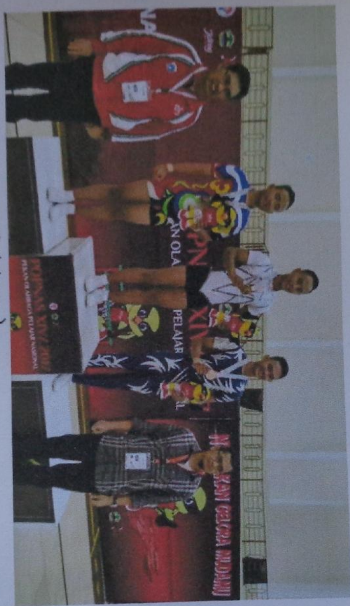
Gambar 3. Pemenang Individual Man