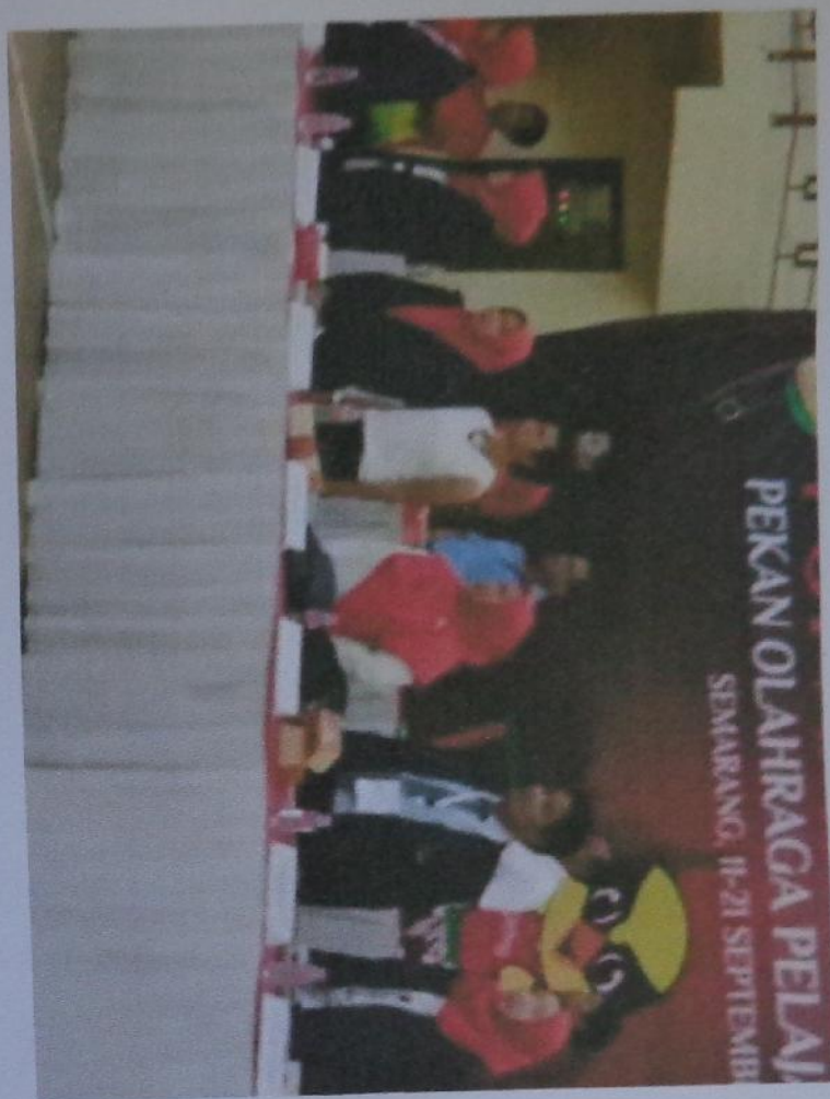
Gambar 2 Upp Pemenang